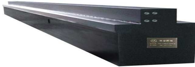
6米导轨 LENGTH OF GUIDE WAY 6M 113-0106